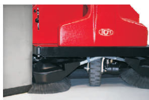
Pendelnder Seitenbesenarm weicht Hindernissen aus