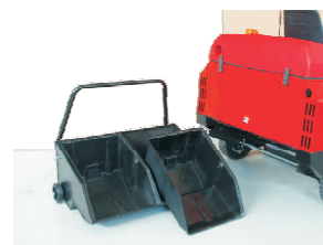
Optional sind zur leichten Entleerung zwei Behältereinsätze zur Gewichtsteilung lieferbar