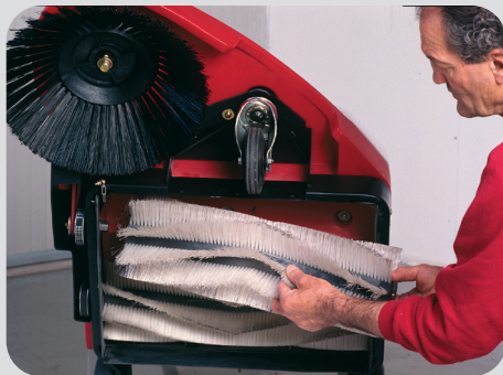
Günstige Kehrwalzen, die sich einfach und schnell auswechseln lassen.